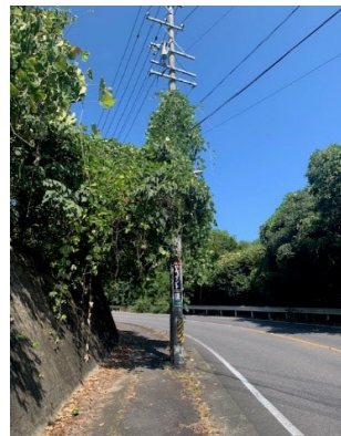
② 比奈知へ抜ける道路

①の「つつじが丘から春日丘へ抜ける道路」の両側は、地権者が複雑に入り交ざっており、管理者を特定できない場合もあり難しいようです。