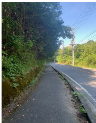
① つつじが丘から春日丘へ抜ける道路