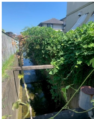
③ 北5・6・7番町を北に流れる用水路

①の「つつじが丘から春日丘へ抜ける道路」の両側については、通行に支障がない程度に伐採を市役所をお願いしています。他は、順番に伐採をしてもらう予定です。